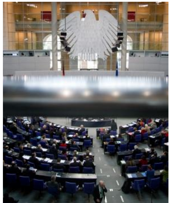
In der sogenannten Haushaltswoche vom 19. bis 23. November 2012 beschloss der Deutsche Bundestag den Bundeshaushalt 2013.

Nachdem es Kulturstaatsminister Bernd Neumann gelungen ist, den Kulturhaushalt achtmal in Folge auf 1,27 Milliarden Euro zu erhöhen, wird dies noch einmal durch die Erhöhung der Haushaltspolitik der Koalitionsfraktionen im Bundestag getoppt. Der Gesamtetat 2013 wird 1,28 Milliarden Euro betragen.