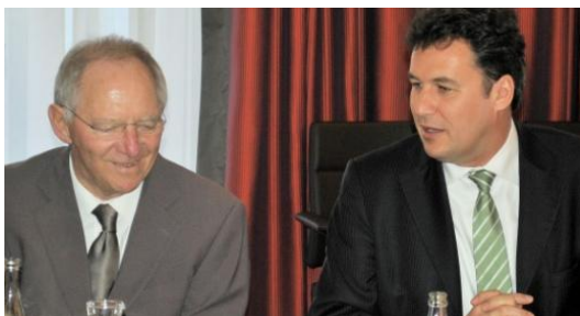
Christian von Stetten im Gespräch mit Bundesfinanzminister Wolfgang Schäuble.

Folgende weitere Maßnahmen werden für die steuerbegünstigten Organisationen mit dem Gesetz eingeführt: